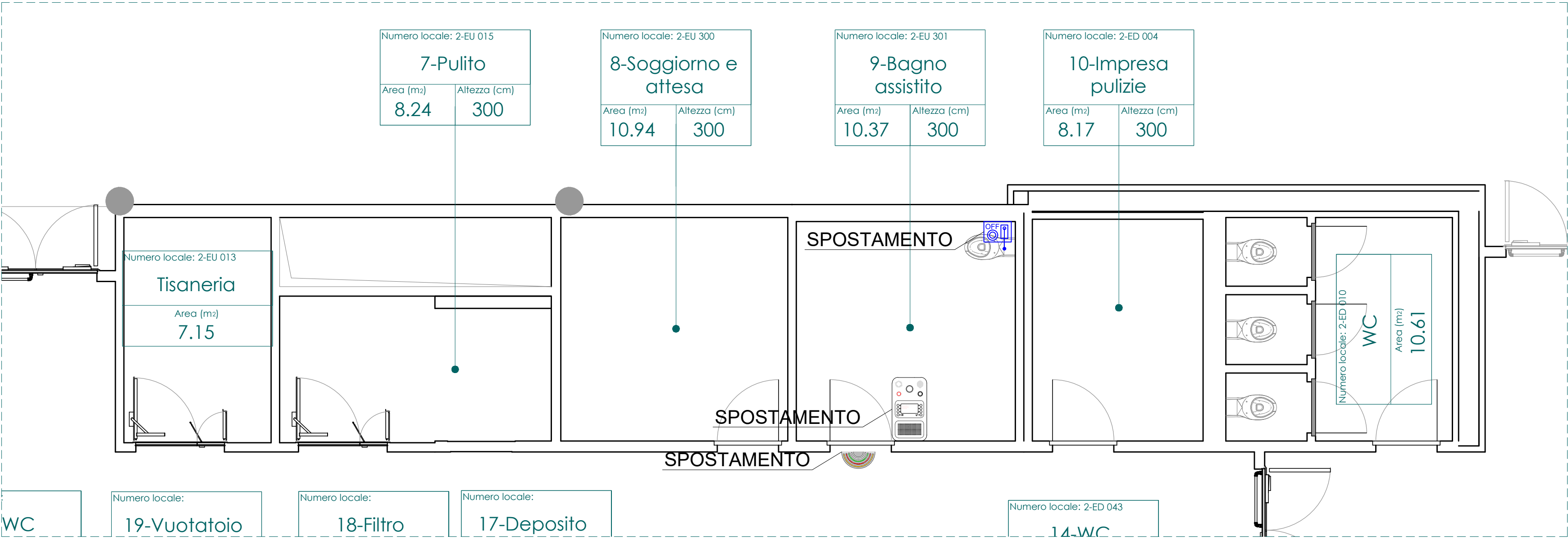
2 Planimetria zona 1B 1 : 50